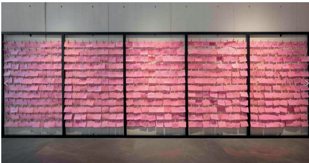
Figura 3. Tendedero , múltiples denuncias de acoso y abuso sexual se han “ventidado” en estos documentos generados en diversos talleres impartidos por la artista feminista.

tendencias.” Tema, La ciudad, fue un momento de crear conciencia sobre el acoso y la violencia contra las mujeres.