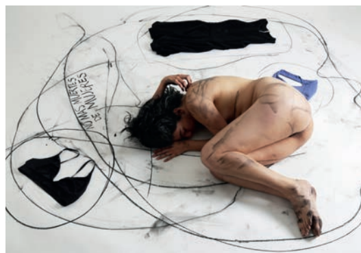
Figura 13. "No más muertes de mujeres", acción performática creada para la serie Armas contra la violencia .