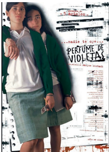
Figura 11. Cartel de Perfume de violetas. Nadie te oye , de Maryse Sistach, año 2000.

Sus películas tienen un claro contenido de crítica social y fundamentalmente feminista, siempre preocupada por los conflictos femeninos.