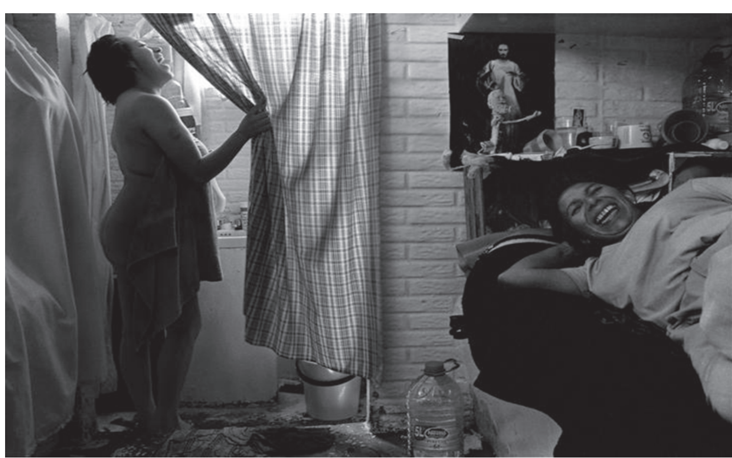
Figura 4. Las horas negras , fotografía de Patricia Aridjis.

"En las estadísticas del INEGI el 90 % de las personas ya piensa que las mujeres y los hombres ya debemos ser iguales. Sin embargo el 85% gasta menos en la educación de sus hijas".